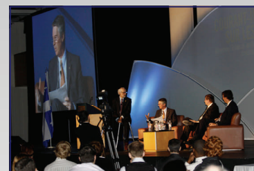
La table ronde « L'ère des services partagés : nouveaux enjeux, nouvelle gouvernance » en a intéressé plus d'un.