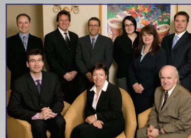
Les membres du comité organisateur peuvent être très fiers du succès de l'événement.