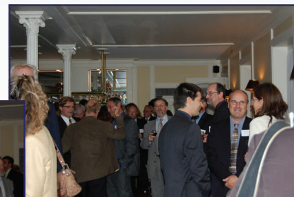
Près de 120 personnes étaient présentes au cocktail de la rentrée.